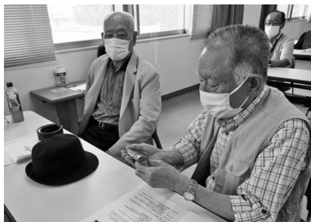
メダルを手に取る参加者

続く会員総会では、代議員会において審議、決定した令和3年度決算並びに令和4年度収支予算等について報告がなされ、懸案事項等について活発な意見交換が行われ有意義な会となりました。